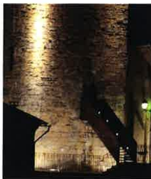
Inauguration du donjon en photos

Pour celles et ceux qui souhaitent recevoir les informations par internet, merci de nous communiquer vos adresses mails.